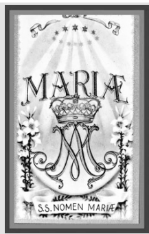
Najświętsze Imię Maryi