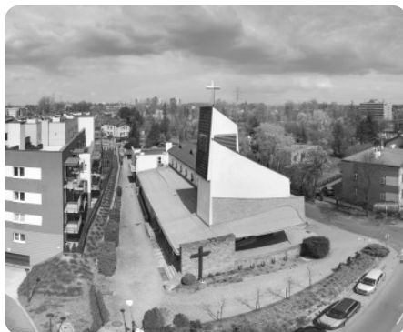
Nasz kościół parafialny