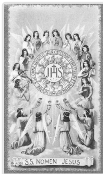
Najświętsze Imię Jezus

Naszej Rodzinie parafialnej życzę mocnej, żywej wiary. Kochajmy nasz kościół parafialny, bo w nim Jezus i Maryja stają się nam Kimś bliskim.