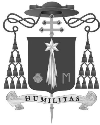
Herb abpa Mieczysława Mokrzyckiego – Metropolity Lwowskiego

W latach 1996-2005 był Ksiądz Arcybiskup osobistym drugim sekretarzem Jana Pawła II. Jak Ksiądz Arcybiskup wspomina ten zapewne błogosławiony czas?