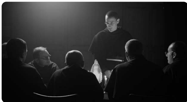
Kadr z filmu RYCERZ wyprodukowanego przez Fundację OPOKA w 2023 roku