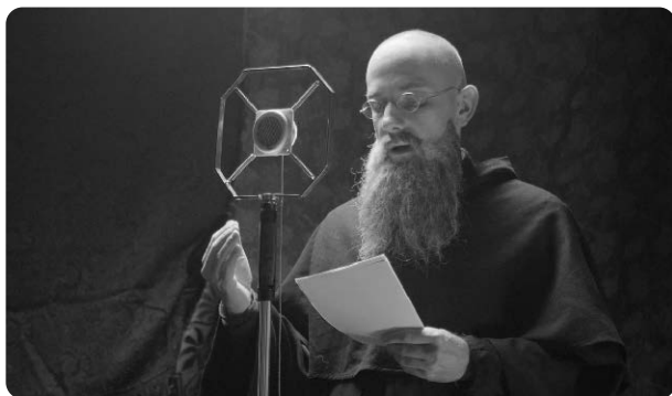
Kadr z filmu RYCERZ

– Nie tylko może zmienić, ale św. Maksymilian zmienił świat. Kiedy podczas apelu w Auschwitz wystąpił z szeregu i oświadczył, że pójdzie na śmierć za współwięźnia, to już zmienił świat. To on był zwycięzcą. Był zapewne wycieńczony, brudny, ale to on rozdawał karty, to on panował nad sytuacją. Niemieccy strażnicy nie mogli mu nic