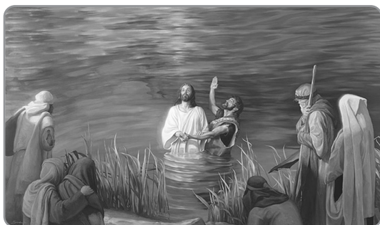
Chrzest Jezusa w Jordanie

Wprawdzie kolędy śpiewamy jeszcze do 2 lutego, ale od poniedziałku powraca już w liturgii kolor zielony, kolor okresu zwykłego. Niedziela Chrztu Pańskiego przypomina o zanurzeniu Jezusa w Jordanie, a także zwraca uwagę na nasz chrzest. Jezus zanurzył się w rzekę ludzkich grzechów, aby wziąć je na siebie. My w chrzcie zostaliśmy zanurzeni w Chrystusa, aby się oczyścić ze zła i otrzymać życie wieczne.