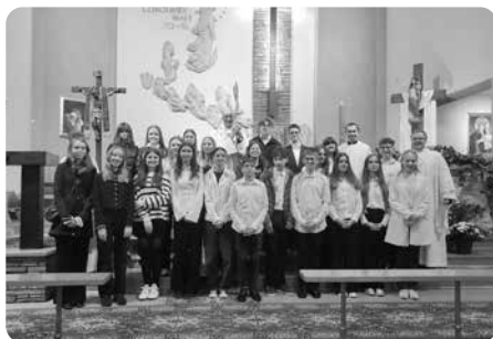
Bierzmowanie – 04.04.2024 r.

Jeżeli dobrze pamiętam, to nie było niczego takiego... Jedyne, o co nas prosił, to żeby ten sakrament nie był dla nas sakramentem odejścia