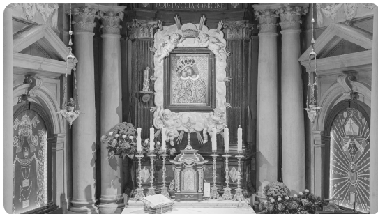
Kaplica Matki Bożej w Sanktuarium Pasyjno-Maryjnym w Kalwarii Zebrzydowskiej – ulubionym miejscu ks. Tomasza Klikowicza

Nam, naszym rodzinom i naszemu narodowi zagrażają różne niebezpieczeństwa, ale są one niczym w porównaniu z tym największym, z zejściem z tej drogi, którą Ona nam wskazuje. Oby zawsze naszej maryjnej pobożności towarzyszyła także maryjna wierność Jej Synowi. Zaprasza nas do tego wezwanie naszej parafii. Amen.