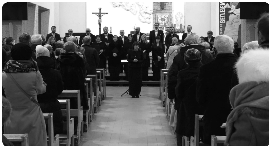
Owacje na stojąco dla Zespołu CAMERATA SILESIA!