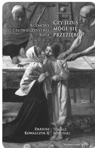
Okładka książki pt. „Czy Jezus może się przeziębic?”

Ale przeziębienie nie jest grzechem (śmiech), a zatem Jezus mógł mieć katar czy grypę. Grzech nie należy do istoty człowieka. Przeciwnie, człowiek został stworzony na Boże podobieństwo, czyli bezgrzeszność jest naszym powołaniem. Maryja, najprawdziwsza z ludzi też była bezgrzeszna, ale pewnie nieraz parzyła dla syna jakieś ziółko. Pomyślmy o rzezi niewiniątek dokonanej przez Heroda. Jezus mógł wtedy zginać. Józef ostrzeżony przez Boga ucieka z Maryją i Jezusem do Egiptu, Józef okazał się narzędziem w rękach Bożej opatrności, ale Bóg nie zawiesza praw natury ani ludzi nie stają się w jego ręku marionetkami, dzia-