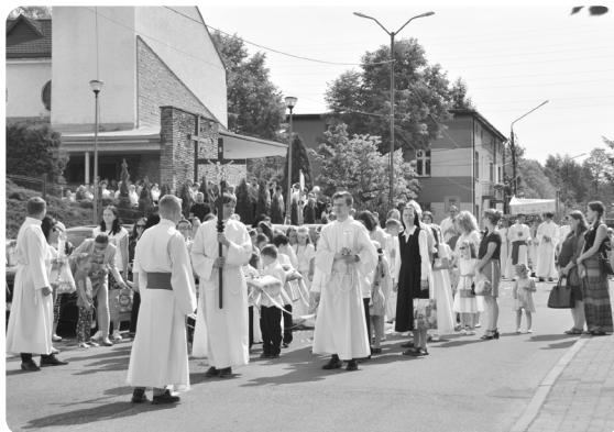
Procesja Bożego Ciała – 16.06.2022

Dziękuję także za wszystkie życzenia urodzinowe, miłe słowa i prezenty. No cóż, szczerze mówiąc mam swoje za uszami, ale mam też świadomość, że jestem w ręku Boga. Jestem z Wami i dla Was jako proboszcz tak, jak potrafię. Ufam, że z Bożą i Waszą pomocą nasza wspólnota parafialna będzie nadal budowała Królestwo Boże. Kończymy czwarty rok razem. Co przed nami, nie wiemy, ale jedno jest pewne, że dokądkolwiek idziemy, Pan Bóg idzie nam naprzeciw.