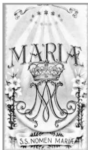
Najświętsze Imię Maryi

Imiona Jezusa i Maryi. Dziś zacytuję tylko refren, a całość wkrótce. „W Imionach tych ukryty świat / w Imionach tych miłości żar / w Imionach tych każdy nasz dzień / w Imionach tych wzajemność serc”.