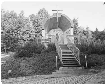
Kaplica Matki Bożej Bolesnej w Cisownicy