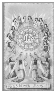
Najświętsze Imię Jezus