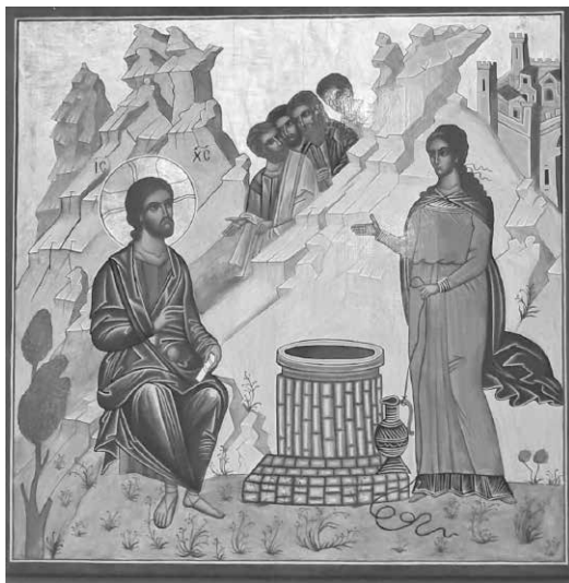
SPOTKANIE JEZUSA Z SAMARYTANKĄ – ikona napisana przez Michała Płoskiego

Jestem zachwycona naszą ikoną „Spotkanie Jezusa z Samarytanką”, bo wnosi ciepło, kolor, radość spotkania. I jakby zachęca do modlitwy, do spotkania z Bogiem... A jakie