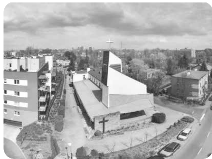
Kościół pw. Najświętszych Imion Jezusa i Maryi w Katowicach-Brynowie

to, co łączy, przeciw temu, co dzieli. To, co stanowi przestrzeń czy wnętrze jedności Jezusa i Maryi jest Sanktuarium dla zbolą-tych, pogubionych serc ludzkich. Szczególnie wszelkie relacje, w których żyjemy i te piękne i te trudne, warto zawierzać jedności tych Imion”. Dotknęły mnie te słowa. Oby imiona naszych parafian zapisane w parafialnych księgach nie były „martwymi duszami”. Oby nasze imiona łączyły się z Imionami Jezusa i Maryi. To ich wzajemne „i”, ich miłość niech i nas jednoczy, ocala, leczy.