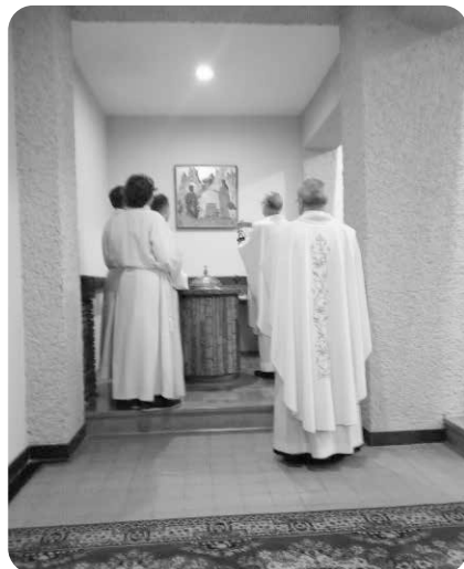
Moment poświęcenia ikony – Spotkanie Jezusa z Samarytanką – w czasie sumy odpustowej 18.09.2022