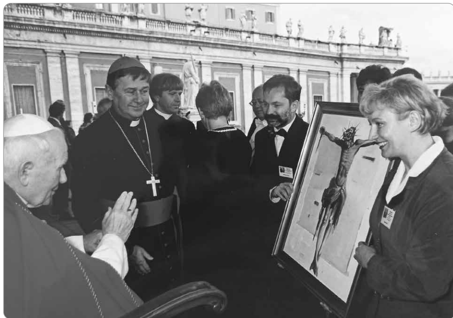
Zofia i Stanisław Wywiotowie wręczają papieżowi Janowi Pawłowi II obraz KRUCYFIKS POLSKI – Rzym 1999 rok.