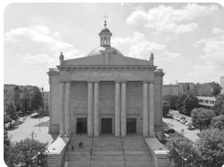
Fasada Katedry Chrystusa Króla w Katowicach