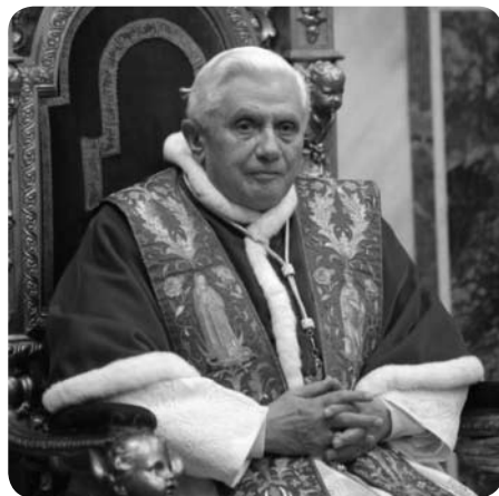
Kard. Joseph Ratzinger w 2005 roku został papieżem Benedyktem XVI

(...) W ostatnich latach słyszeliśmy dość wyraźne głosy, które mówią: Czas wież i dzwonów minął; nie pasują już one do naszego świata, który jest całkiem inny. W miastach stoją wieżowce, tak że wieże kościelne stały się przy nich karłami. Pomyślmy choćby o katedrze św. Patryka w Nowym Jorku, która między ogromnymi wysokościami robi wrażenie miniaturowej. W tym zupełnie innym świecie wieże kościelne straciły zatem swój charakter punktu orientacyjnego. Bicie dzwonów tak czy owak nie będzie słyszalne w hałasie naszych miast i miejscowości. A tam, gdzie byłyby słyszalne, powinniśmy go oszczędzić udręczonym hałasem ludziom, tak, aby mieli trochę ciszy. Ostatecznie wszyscy mają dzisiaj zegarki i sami wiedzą, która jest godzina i kiedy trzeba iść na Mszę świętą.