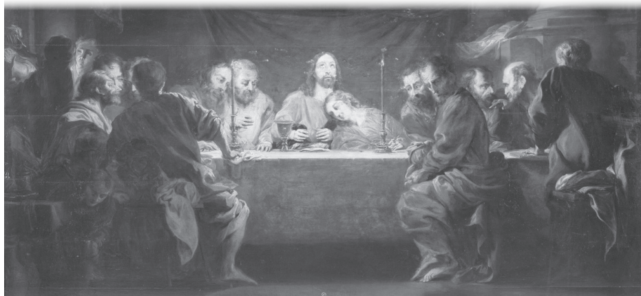
Ostatnia Wieczerza – obraz Michaela Willmanna z ok. 1661 roku pochodzący z klasztoru Cystersów w Lubiążu, obecnie w zbiorach Muzeum Narodowego we Wrocławiu