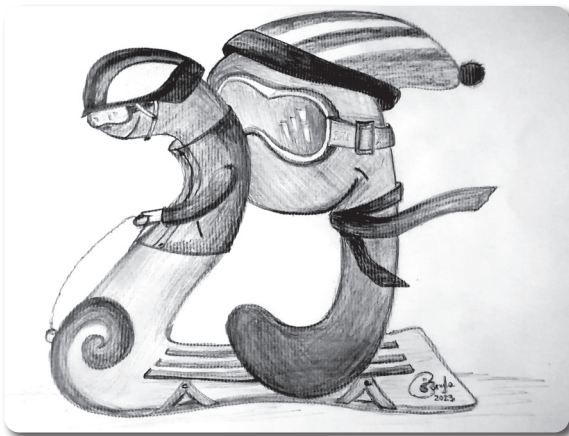
Autorką rysunku jest Gabriela Gocyla