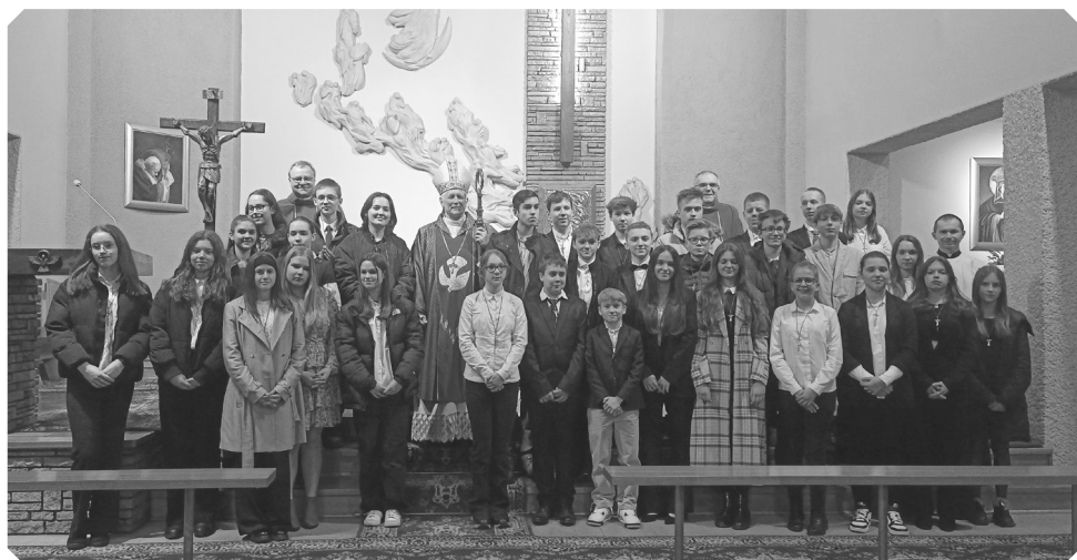
Bierzmowanie – 2 marca 2023