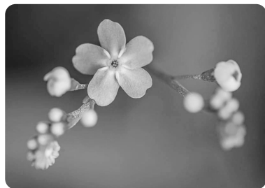
Niezapominajka