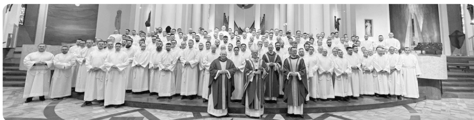
158. nowych Nadzwyczajnych Szafarzy Komunii Świętej zyskała nasza archidiecezja 26 marca br.