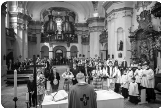
Chrzest w kościele parafialnym. Na ścianach stacje Drogi Krzyżowej z Brynowa

W Domażlicach znajdują się jeszcze kolejne trzy kościoły, w których jest sprawowana liturgia. Od kilku lat, kiedy nastąpiło w diecezji łączenie mniejszych parafii w jedną większą, mam pod opieką duszpasterską dziewięć takich parafii, w których odprawiamy niedzielne Msze św. Na szczęście nie jestem sam, mam do pomocy dwóch starszych księży w wieku 73 i 82 lat.