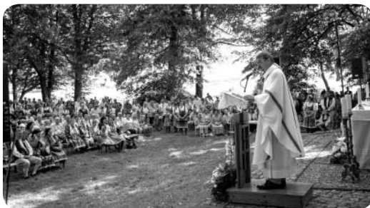
Odpust na Wawrzyneczku

ne święta, na przykład na Boże Ciało i odpusty. Największym z nich jest odpust ku czci św. Wawrzyńca, mający także patriotyczne znaczenie. W roku 1939 przyjechało do Domażlic ponad 100.000 pielgrzymów, protestujących przeciw polityce faszystowskich Niemiec. Natomiast w latach 1948 do 1989 komuniści zakazali obchodzenia tych uroczystości. Dziś na Wawrzyneczku spotyka się na odpuscie kilkaset osób, w tym wiele w pięknych strojach. Dla ilustracji można zajrzeć do naszej fotogalerii www.zonerama.com/RKFDomazlice . Drugim ważnym elementem miejscowego folkloru są lokalne ludowe zespoły pieśni i tańca, szczególnie z Mrakova i Pobieżowic, a także liczni dudziarze. Warto znaleźć odpowiednie strony w internecie.