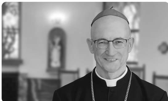
Arceybiskup Metropolita Katowicki Adrian Galbas SAC

W Konferencji Episkopatu Polski jest Przewodniczącym Rady ds. Apostolstwa Świeckich raz członkiem Zespołu przy Delegacie KEP ds. Duszpasterstwa Emigracji Polskiej.