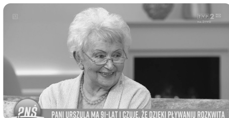
Zrzut ekranu z audycji TVP 2 „Pytanie na śniadanie” – 23 maja 2023

Dziękuję. Pływanie fantastycznie wpływa na kondycję fizyczną i zdrowotną. Znakomicie poprawia samopoczucie; gdy pływam, nie mam problemu z kręgosłupem. Najczęściej pływam kraulem i stylem grzbietowym. Mój przykład świadczy o tym, że pływać każdy może i to w każdym wieku, bo to jest aktywność bez żadnych obciążeń. Gorąco polecam ten rodzaj sportu; na pływanie nigdy nie jest się za starym, człowiek rozwija się do końca życia, a na basenie można wspólnie spędzać wolny czas. Sport daje energię i odwagę, odmładza duszę. No i muszę podkreślić, że katowiccy seniorzy z Kartą Mieszkańca płacą za korzystanie z basenu tylko 4 złote za godzinę. Niestety mało seniorów uprawia pływanie i bardzo boli mnie fakt, że nie mam konkurencji. Wciąż jestem na wszystkich zawodach najstarszą pływaczką w Polsce.