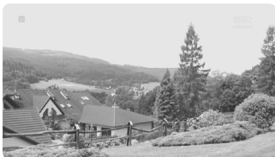
Ośrodek w Brennej położony jest w pięknej scenerii Beskidu Śląskiego